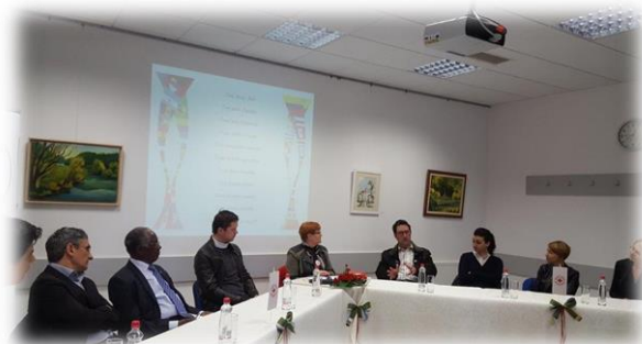
Okrogla miza Moj sosed je drugačen, 2017