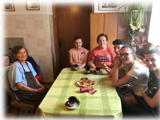
Utrinek z letošnjega tabora v Šmarjeških Toplicah, 2017