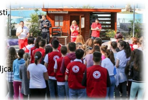
Tekmovanje ekip PP na Debelem rtiču, 2017