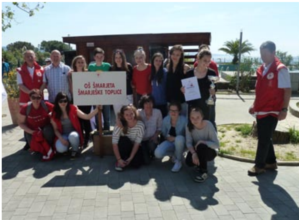
Ekipa OŠ Šmarjeta na Debelem rtiču