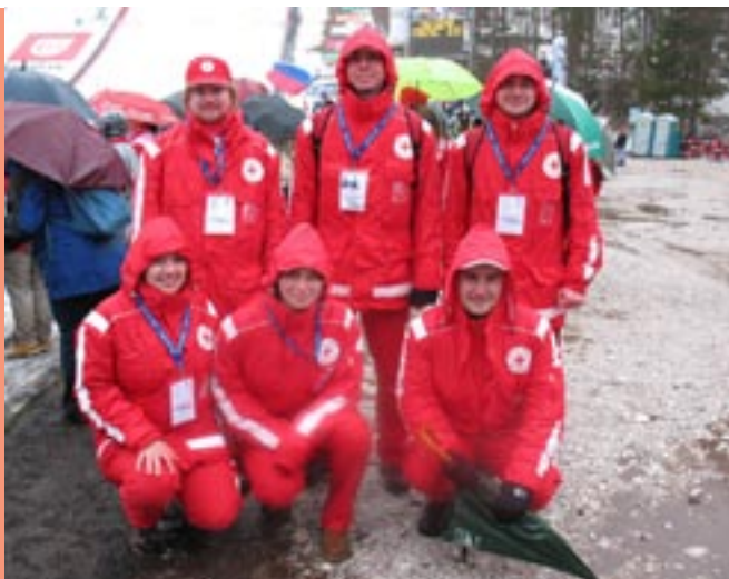
Dež v Planici naši ekipe prve pomoči ni vzel volje.

Ekipe prve pomoči že izpopolnjujejo svoje zanje za Regijsko preverjanje usposobljenosti ekip prve pomoči RK in CZ, ki bo 14. junija v občini Žužemberk.