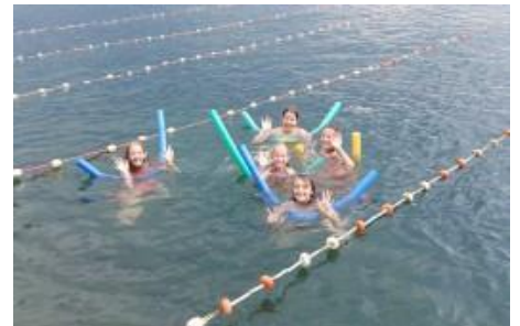
Vodne radosti na Debelem rtiču

Otroci so imeli delavnice prve pomoči, sproščanja in zdrave prehrane, ustvarjalne delavnice, športne aktivnosti, tečaj plavanja in izlet z ladjico v Izolo. Letovanje je bilo cenovno ugodno, saj ga sofinancirajo ZZS in vse občine z območja delovanja OZ RKS NM.