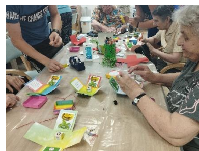
Ustvarjanje v DSO Novo mesto

Od 27.–30. 6. 2022 je potekal humanitarni počitniški teden mladih, ki je nadomestil tradicionalni humanitarni tabor mladih. Udeležilo se ga je 17 mladih prostovoljcev iz različnih šol, ki so vse dni ali samo kakšen dan sodelovali pri ustvarjalnih delavnicah v DSO Novo mesto, nudili različne oblike pomoči socialno ogroženim, pomagali pri pripravi paketov v skladišču in se tudi medsebojno družili in sproščali. Humanitarni teden je uspel, saj so bili uporabniki hvaležni za pomoč in druženje z mladimi.