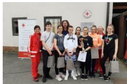
Ekipe PP iz OŠ Vavta vas v Gradacu

Dve ekipi sta se 5. maja udeležili regijskega tekmovanja v Gradacu. Ena od ekip je zasedla 2. mesto in se 16. maja udeležila državnega tekmovanja v Kopru. Tam se je pomerilo 11 ekip, ekipa OŠ Vavta vas je zasedla 3. mesto .