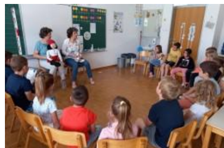
Križem kapica na OŠ Drska

70 otrok je tako spoznalo humanitarno dejavnost Rdečega križa, Križem kapica pa jih je obdarila s pobarvanko, obliži in štampiljko. Tudi otroci so se z drobno pozornostjo zahvalili prostovoljkama za obisk.