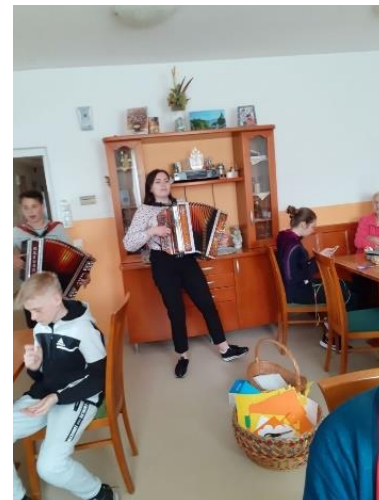
Ustvarjanje z glasbo v Penzionu Sreča v Orešju pri Šmarjeti