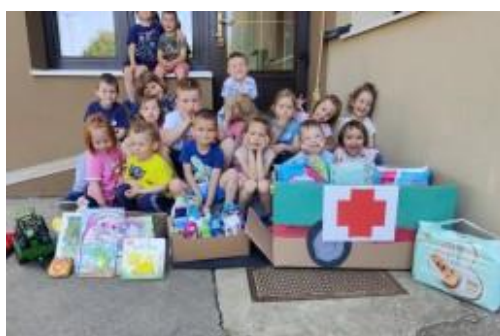
Otroci iz vrtca na Dolžu z zbranimi izdelki

Ob tednu Rdečega križa so v OŠ Bršljin, Brusnice, Drska, Dolenjske Toplice, Toneta Pavčka Mirna Peč, Stopiče, Šmarjeta, Šmihel in Vavta vas organizirali humanitarno akcijo Košarica RK . Skupaj so zbrali za 5.674 evrov različne hrane z dolgim rokom trajanja in higienskih izdelkov, iz katerih smo oblikovali 189 paketov za socialno ogrožene družine in posameznike. Na štirih šolah so zbirali tudi šolske potrebščine, ki jih bomo razdelili otrokom na začetku novega šolskega leta. Šolarjem so se pridružili tudi vrtičkarji na Dolžu.