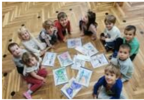
Otroci iz Vrtca Ciciban s pobarvankami