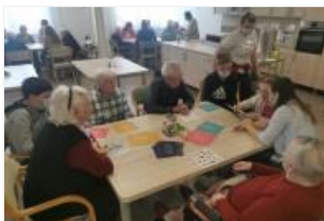
Miselnice igre v DSO Novo mesto

8. aprila smo se priključili 13. akciji Slovenske filantropije s sloganom Nisi sam – soustvarjamo skupnost . Povezali smo mlade iz OŠ Šmarjeta in Šmihel, Gimnazije Novo mesto, Ekonomske šole Novo mesto, Šolskega centra Novo mesto – SEŠTG, študente Fakultete za zdravstvene vede Novo mesto in predstavnice KORK s stanovalci Doma starejših občanov Novo mesto in Penziona Sreča iz Orešja pri Šmarjeti. 180 mladih in starejših je ta dan »soustvarjalo skupnost« z izdelovanjem velikonočnih izdelkov, glasbo, petjem in miselnimi igrami. Za DSO Novo mesto smo izdelali 7 plakatov (za vsako stanovanjsko enoto) z utrinki dejavnosti. Vsi udeleženci so prejeli skupne zahvale Slovenske filantropije in OZ RKS Novo mesto.