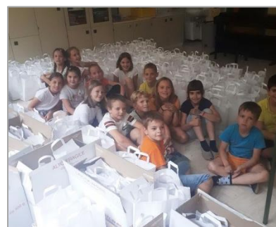
Priprava paketov v Žužemberku

Otroci so skupaj s prostovoljkami KORK obiskali starejše na domu in jim izročili pakete z nekaj priboljški in zloženko s koristnimi informacijami.