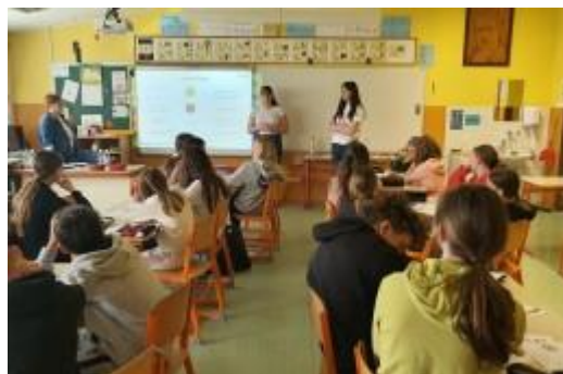
Delavnica na OŠ Šmarjeta