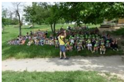
Otroci iz Vrtca Ciciban zbrani v Ločni

Ker je v tednu RK odpadla zaključna prireditve s podelitvijo priznanj in zahval za natečaj Nisi sam - slika drobne pozornosti, smo v tednu od 24. do 27. maja obiskali vse nagrajene šole in se vodstvu in mentorjem zahvalili za sodelovanje. V Vrtcu Ciciban v Ločni in na OŠ Šmarjeta (skupaj z Vrtcem Sonček ) so otroci in mentorji pripravili prisrčen program. Na OŠ Drska , Gimnaziji Novo mesto in Višji strokovni šoli (medijska produkcija) na Ekonomski šoli Novo mesto pa smo dobili zagotovilo, da bodo pri naših projektih še radi sodelovali.